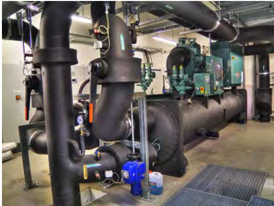
Kältemaschine mit Turbo-Verdichter (1.200 kW)