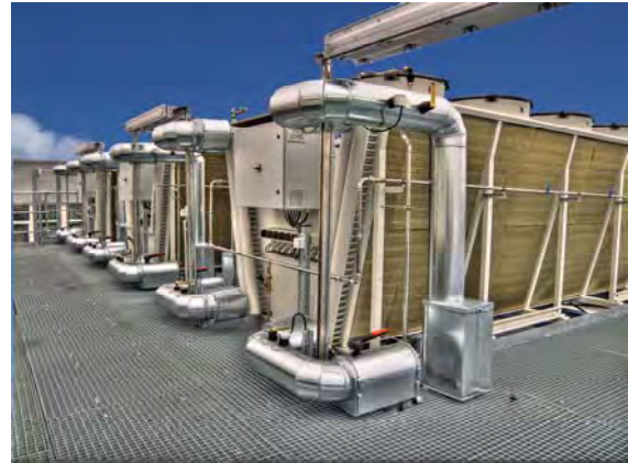
Rückkühler (3 Stück mit je 500 kW)

Bauherr: DeTeImmobilien Deutsche Telekom Immobilien und Service GmbH Niederlassung Region Ost Dernburgstraße 50, 14057 Berlin