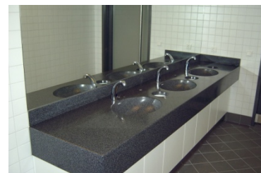
Pressezentrum 1. OG WC-Bereich