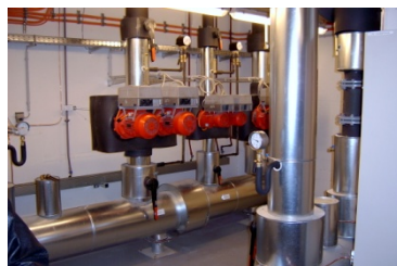
Kältezentrale 3. OG