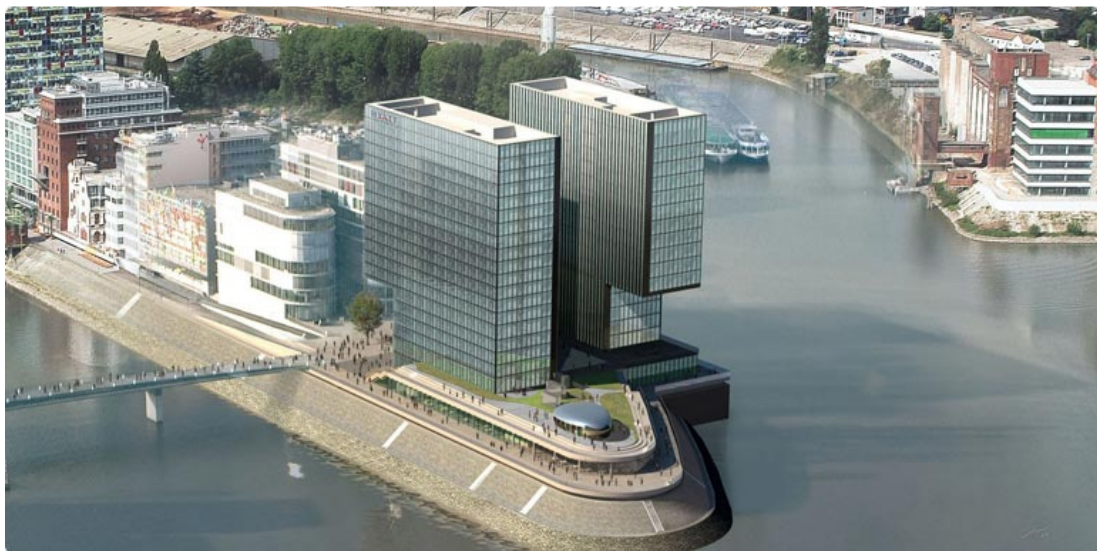
Ansicht „Hyatt Regency Hotel“ in Düsseldorf